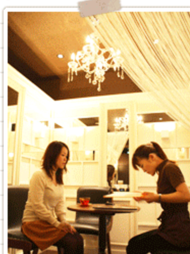
丁寧なカウンセリングで緊張がほぐれていくモニターさん