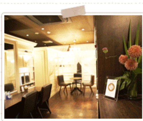
内装もお洒落で雰囲気も◎です！

さらに、全スタッフさんは長年経験を積まれたベテラン揃い！どのスタッフさんでも 技術力が高い上に人当たりも良く、通年でアドバイス をくれるのも嬉しい♪とリピーターさんから大好評！