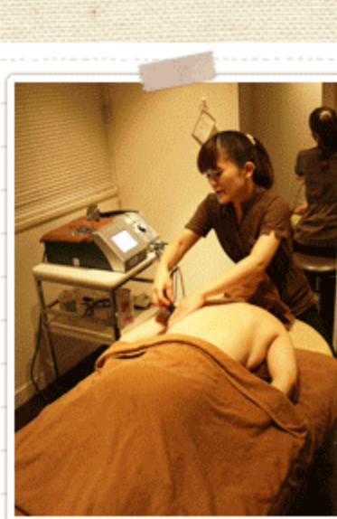
肩甲骨周辺を重点的に！

小さいエレクトロード（キャバ）・・・ 皮膚、脂肪、筋肉 などの浅い部分を重点的に温めて、 セルライト分解 やウエストのくびれを作るのに効果を発揮します。