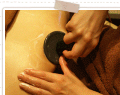
首・肩こりの解消にも効果あり♪