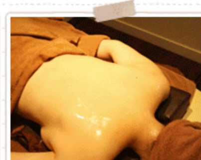
埋もれていた肩甲骨が現れてきました！