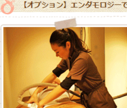
痛みもなく寝てしまうほどの気持ち良さ♪

インディバに組み合わせると更に効果的なのが、不動の人気を誇る『エンダモロジー』♪ 美BODY をつくっていきます♪